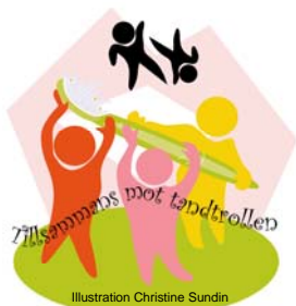
Illustration Christine Sundin

Ett samarbetsprojekt mellan Folk tandvården, förskolan, familjedaghemmen och fritidshemmen för att återinföra tandborstning med fluortandkräm efter frukost