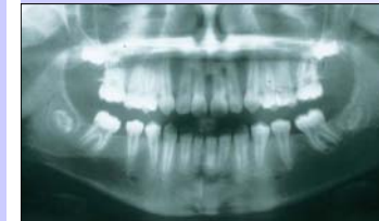
10 år ½ år postex