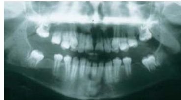
10 år 1½ år postex