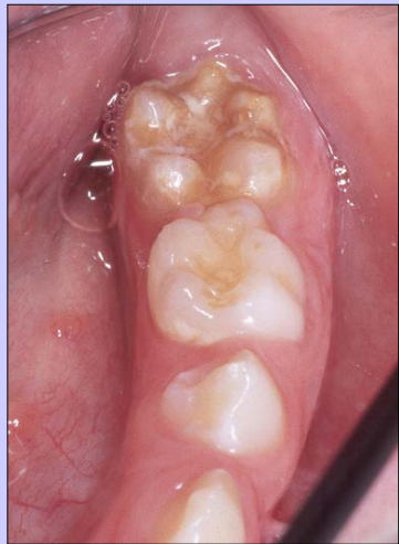
Laboratorie- framställd krona