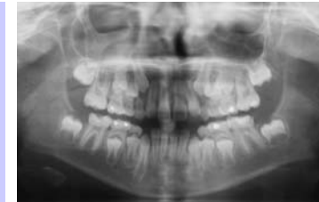
Sara 7½ år

Jälevik & Möller, International Journal of Paediatric Dentistry 2007; 17: 328-335