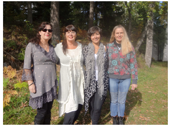
Glada deltagare från Kristianstad.

För alla er som inte var med den här gången kommer glädjebesked att alla föreläsningsanteckningar läggs in i förkortad version på vår hemsida, www.spf.nu inom kort.