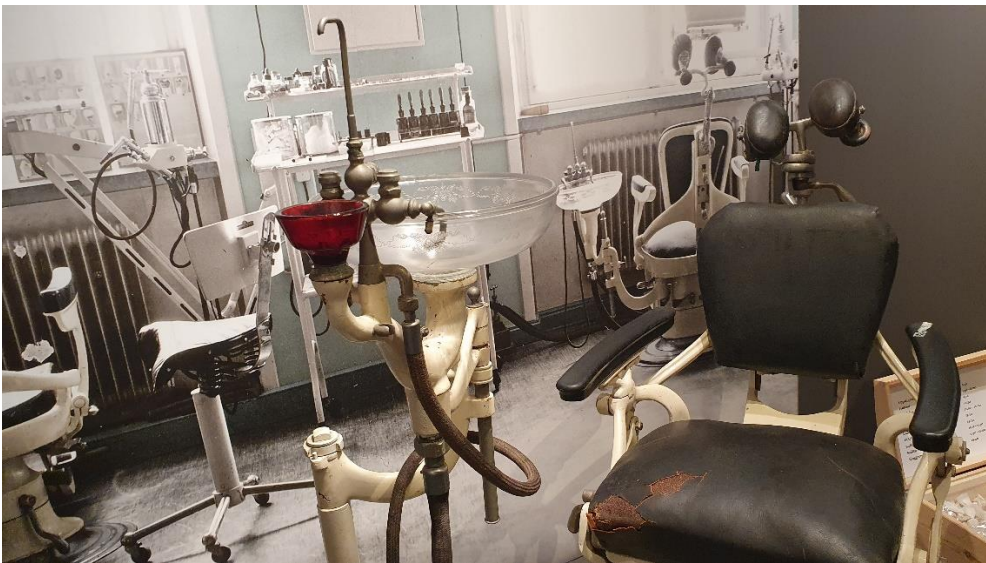
Tandläkarutrustning Vipeholm, nu på Livets museum i Lund.