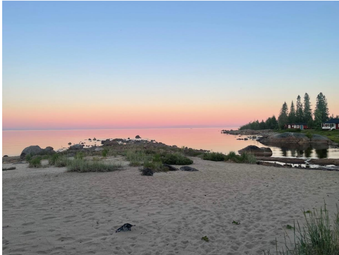
Ulldalsviken Robertsfors kommun, Västerbottens län

Nummer 1-2024, Årgång 34, ISSN 2001-9483